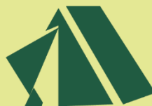
Deportes y tiempo libre