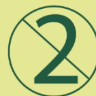
Un solo uso. Evita la acumulación de hongos y bacterias.